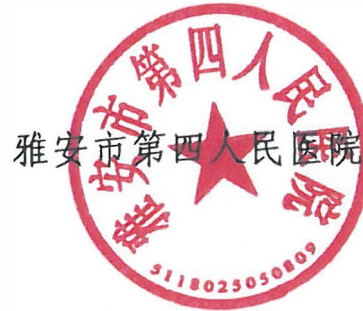
雅安市第四人民医院