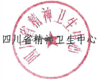
四川省精神卫生中心